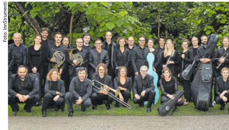
Das Tiroler Kammerorchester InnStrumenti hat viel vor

menti“ die Jüngerer am Herzen, die nach dem Motto „Ab InnS' Konzert!“ live und online zu Schülerkonzerten eingeladen werden. Die Konzertsaison führt das Orchester zum Europäischen Forum in Alpbach, zu den Südtiroler Festspielen nach Toblach, zum Festival Zeitimpuls im ORF Tirol, zu den „horizonten“ Landeck, zu einem der renommiertesten Literaturfestivals in Baden-Württemberg, nach Wien sowie in alle Tiroler Landesteile und weiter nach Südtirol. Hubert Berger