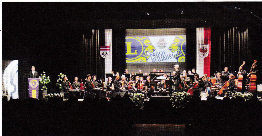
Musikalischer Jahresauftakt mit dem Neujahrskonzert im festlichen Silbersaal.